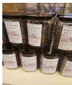
Pavés du Lion (250g)