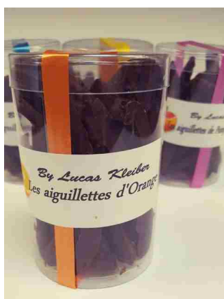
Les aiguillettes (150g)