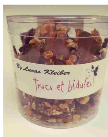
Les Trucs et Bidules (300g)