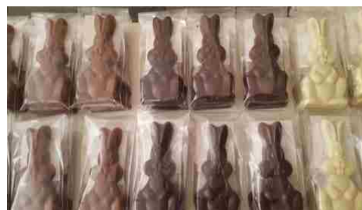
Tablettes Lapin (100g)

Vous pouvez partager le lien suivant sur les réseaux sociaux : www.Compagnons-Dambach-la-Ville.org/chocolat