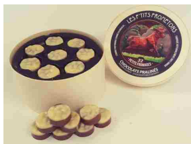
Les Frometons (220g)