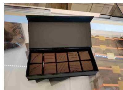
Black diamonds (200g)