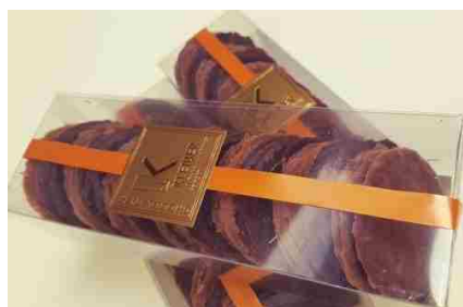
Les Craquelinettes (170g)